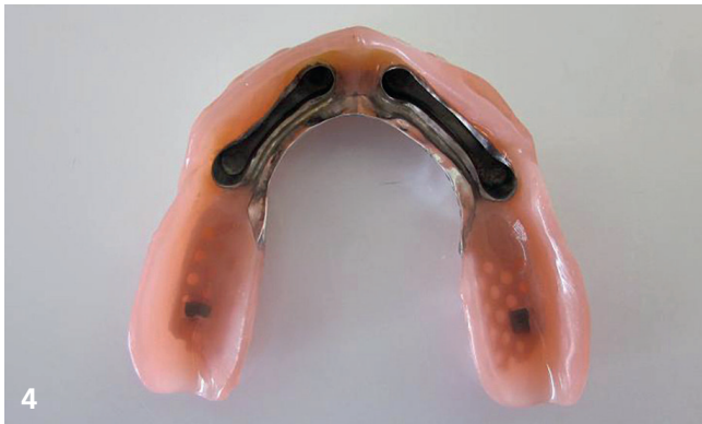
Zahnersatz mit integrierten Stegmatrizen