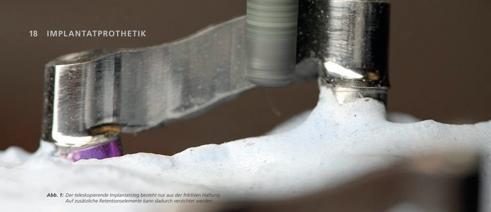
Abb. 1: Der teleskopierende Implantatsteg besteht nur aus der friktiven Haftung. Auf zusätzliche Retentionselemente kann dadurch verzichtet werden.